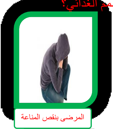
المرضى بنقص المناعة

هل تعرف من هم الأشخاص الأكثر عرضة للتسمم الغذائي؟